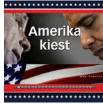
Webspecial Amerika Kiest 2008