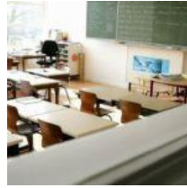
Banen Nieuw: carrièresite voor onderwijzers