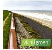
Groen Groen staat voor duurzaamheid.