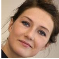
Reizen Carice van Houten weet niet wat vakantie is